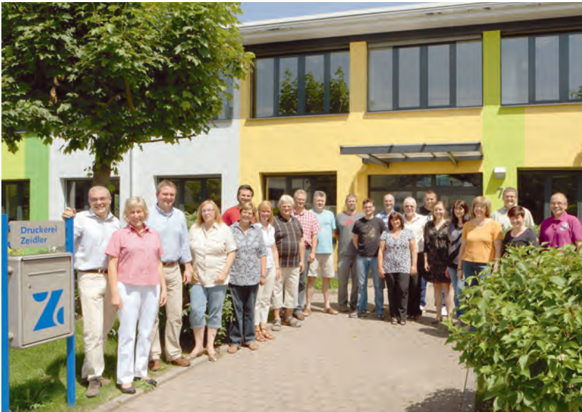
Das heutige Team der Druckerei Zeidler vor dem Firmensitz in der Fritz-Ullmann-Straße 7.